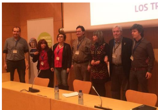
Representantes del CE y Asociaciones de Pacientes

6 y 7 de febrero de 2016. Representación y participación en la mesa redonda: La Tartamudez en la Sociedad Civil (Asociaciones de personas que tartamudean y Clínicos) del I Congreso Internacional "Trastornos de la fluidez del habla" en Barcelona